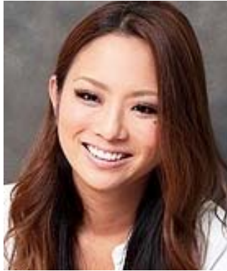
閉会の挨拶及び副賞の授与