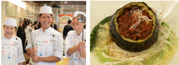
⑤奈良県立磯城野高等学校 「旨カリ丸ボーナス」