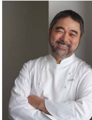
審査員及び開会の挨拶