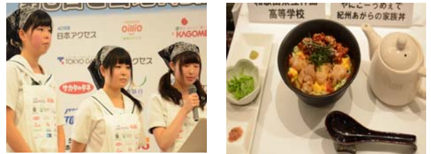
⑥和歌山県立神島高等学校 「やにこーうめえで紀州あがらの家族丼」