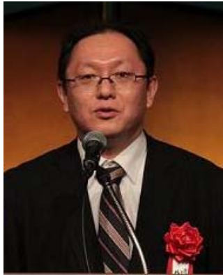
ミラノ博覧会政府代表賞の授与