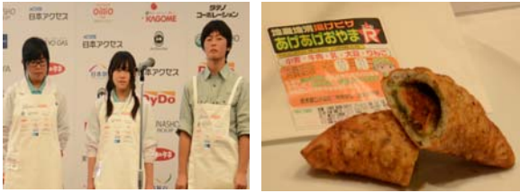
①栃木県立小山北桜高等学校 「地産地消揚げピザあげあげおやま☆R(エール)」