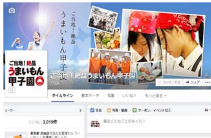
公式フェイスブック