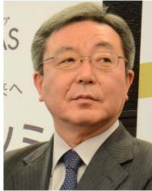
農林水産大臣賞及び 食料産業局長賞の授与