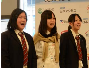
⑨宮城県農業高等学校 「カラフルオムライスボール」