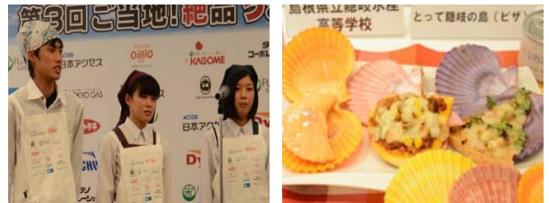
④島根県立隠岐水産高等学校 「とって隠岐の島(ピザ)」