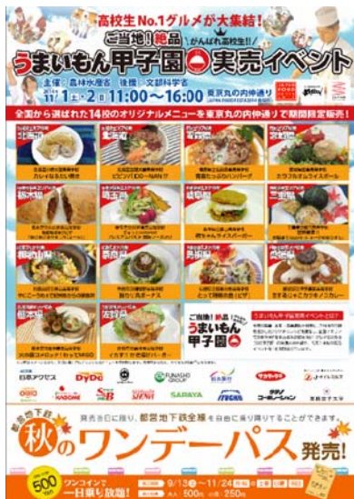
(都営地下鉄メトロ101駅)