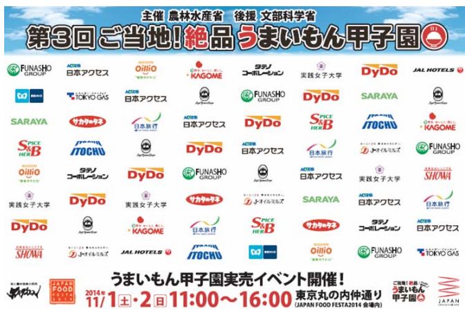
イベントボード(大)