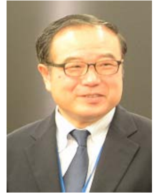
水産庁長官賞の授与