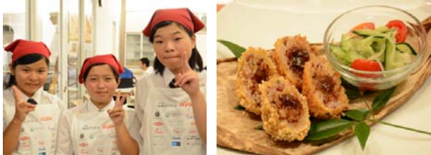
⑦熊本県立鹿本農業高等学校 「火の国コメロッケ！わってMISO」