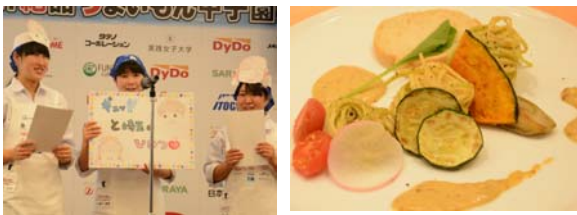
③埼玉県立杉戸農業高等学校 「ぎゅっとsaitama!! プレミアムパスタ・諸味ソースがけ」