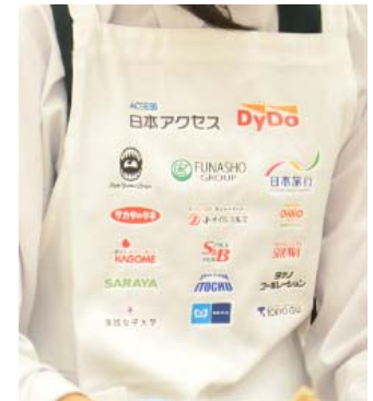
決勝大会用 エプロン