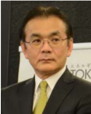
生産局長賞の授与